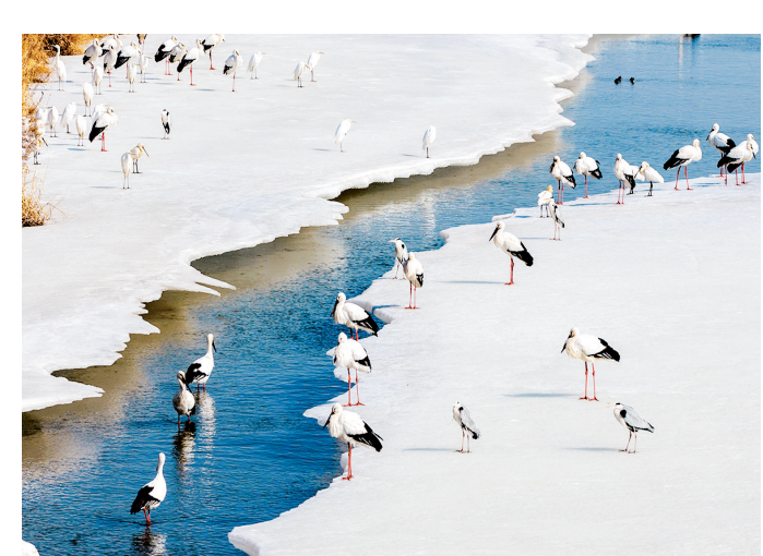
3月23日，在黑龙江省双鸭山市宝清县境内的黑龙江东省省级自然保护区内，一群候鸟在冰面上休息。春日，中国最北省份黑龙江冰雪消融，各类候鸟陆续飞抵省内各处湿地与水城，为北国春色增添一抹灵动生机。