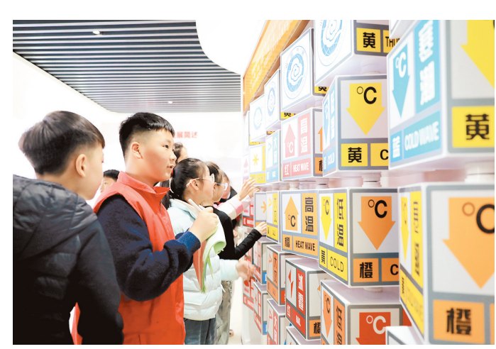
3月23日，小学生在河南省焦作市温县气象科普馆参观。3月23日是世界气象日，多地组织开展气象科普活动，普及气象知识。