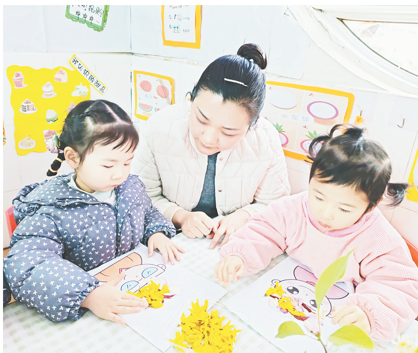
3月19日，召陵区实验小学幼儿园分园开展春季区域活动。图为美工区的小朋友在老师指导下，用花朵为人物进行发型设计。