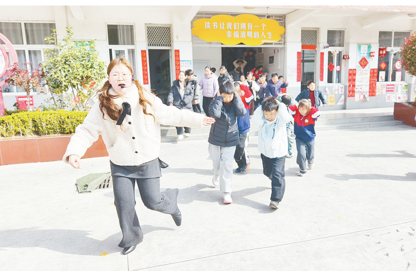
3月20日，源汇区受降路小学组织全体教师开展消防应急疏散演练暨安全教育实践活动，以实战化演练夯实平安校园建设基础。