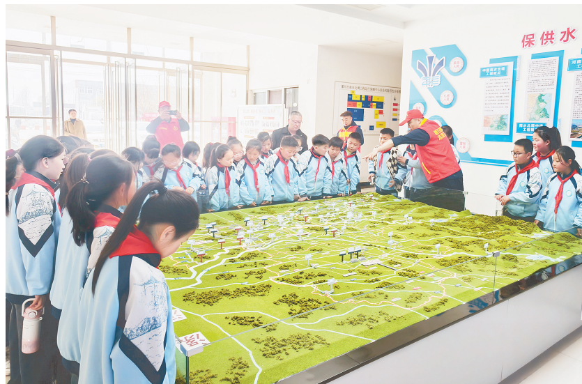
3月22日，源汇区第三实验小学组织四年级的师生代表100余人走进市区三水厂、沙澧连通节制闸、南水北调中心，开展了一场别开生面的研学实践活动。