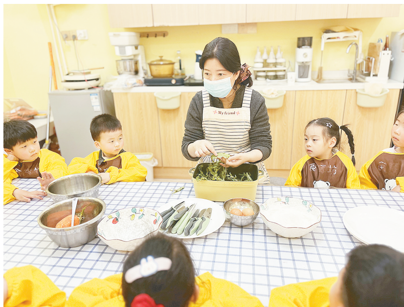
近日，市直幼儿园开展“春分知时节 童趣乐无边”主题教育，让孩子们在沉浸式体验中感受春日美好，接受传统文化熏陶。