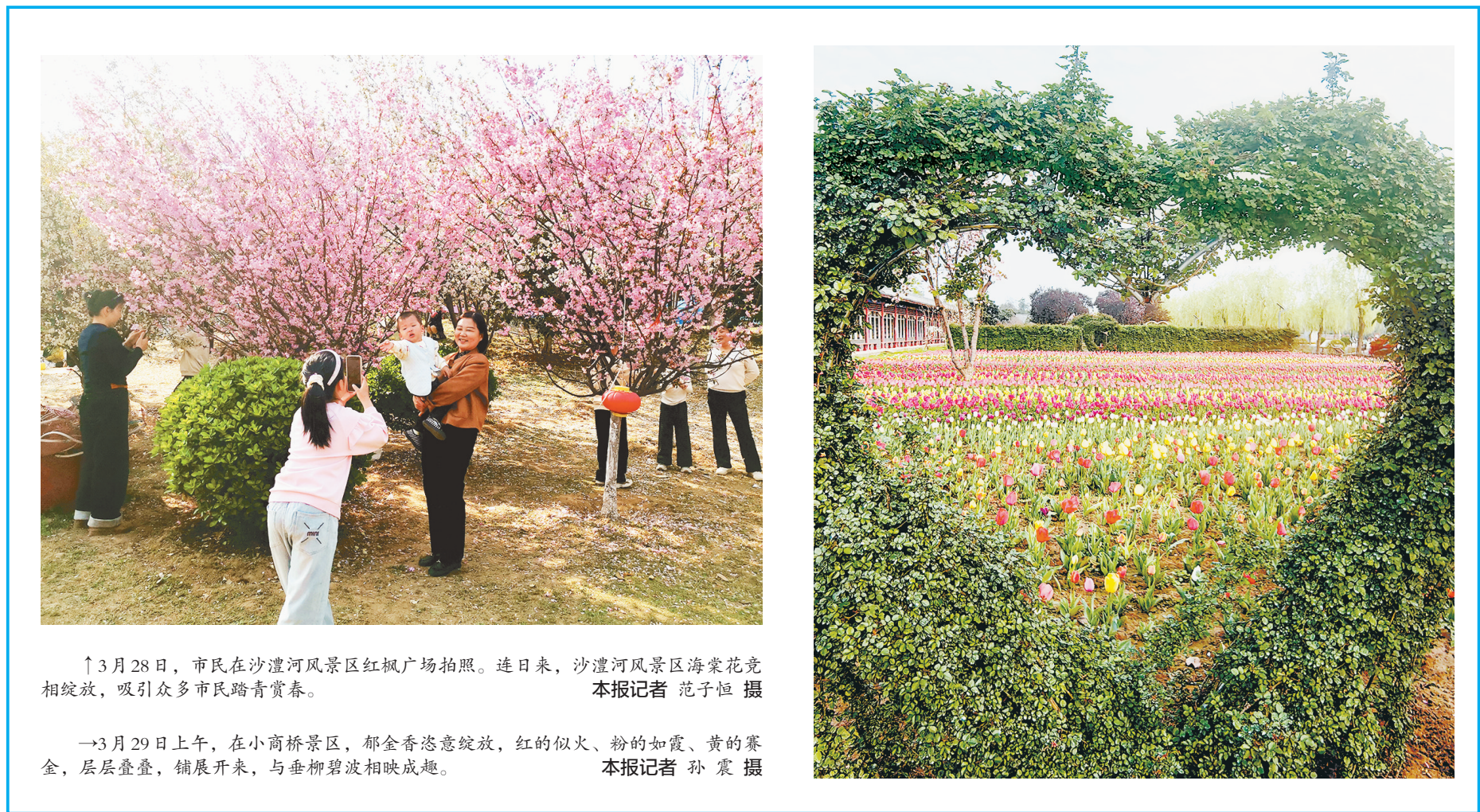
↑3月28日,市民在沙澧河风景区红枫广场拍照。连日来,沙澧河风景区海棠花竞相绽放,吸引众多市民踏青赏春。

据了解,此次春季消费季由商务局指导,市住房和城乡建设局、市文化广电和旅游局、市市场监督管理局、市工商业联合会等支持,漯河日报社主办。随着3月29日晚活动的圆满落幕,这场吃喝玩乐购一站式尽享的春日盛宴,在市民的赞誉声中收官。未来,我市将持续举办更多惠民消费活动,以文化聚人气、以消费促发展,不断增强市民获得感、幸福感,为全市经济高质量发展持续添力。