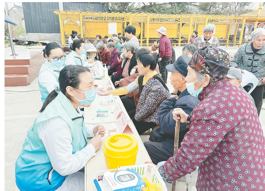
3月25日、26日，漯河医专二附院（漯河市骨科医院、漯河市立医院）组织舞阳县、临颍县籍医疗专家，分别走进舞阳县姜店镇郎庄村、临颍县王岗镇滕寺村开展“名医故乡行”巡回义诊。图为该院医疗专家在临颍县王岗镇滕寺村义诊。