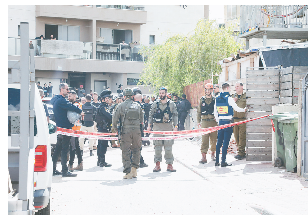
三月三十一日，在以色列中部城市布内布拉克，应急反应人员在导弹袭击现场工作。