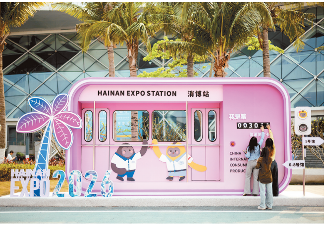
4月13日,人们在第六届消博会主会场海南国际会展中心外打卡。

消费春意浓,离不开政策春风暖。继江苏、安徽等地率先探索实施春假后,近期又有多地陆