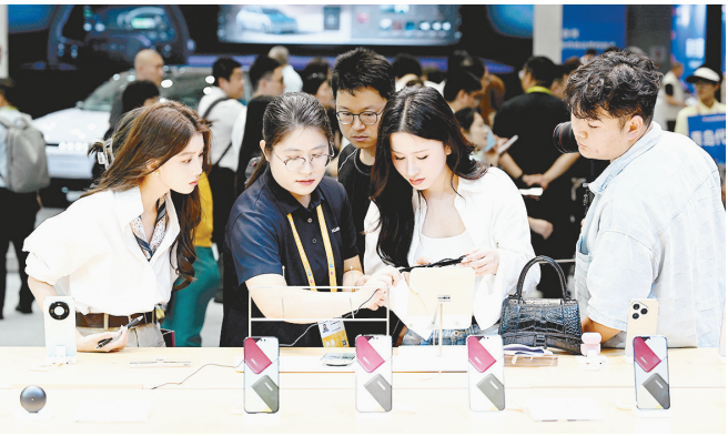
4月13日,参观者在第六届消博会主会场了解华为产品。