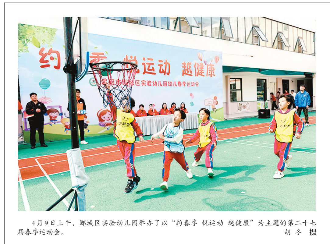
4月9日上午,郾城区实验幼儿园举办了以“约春季 悦运动 越健康”为主题的第二十七届春季运动会。