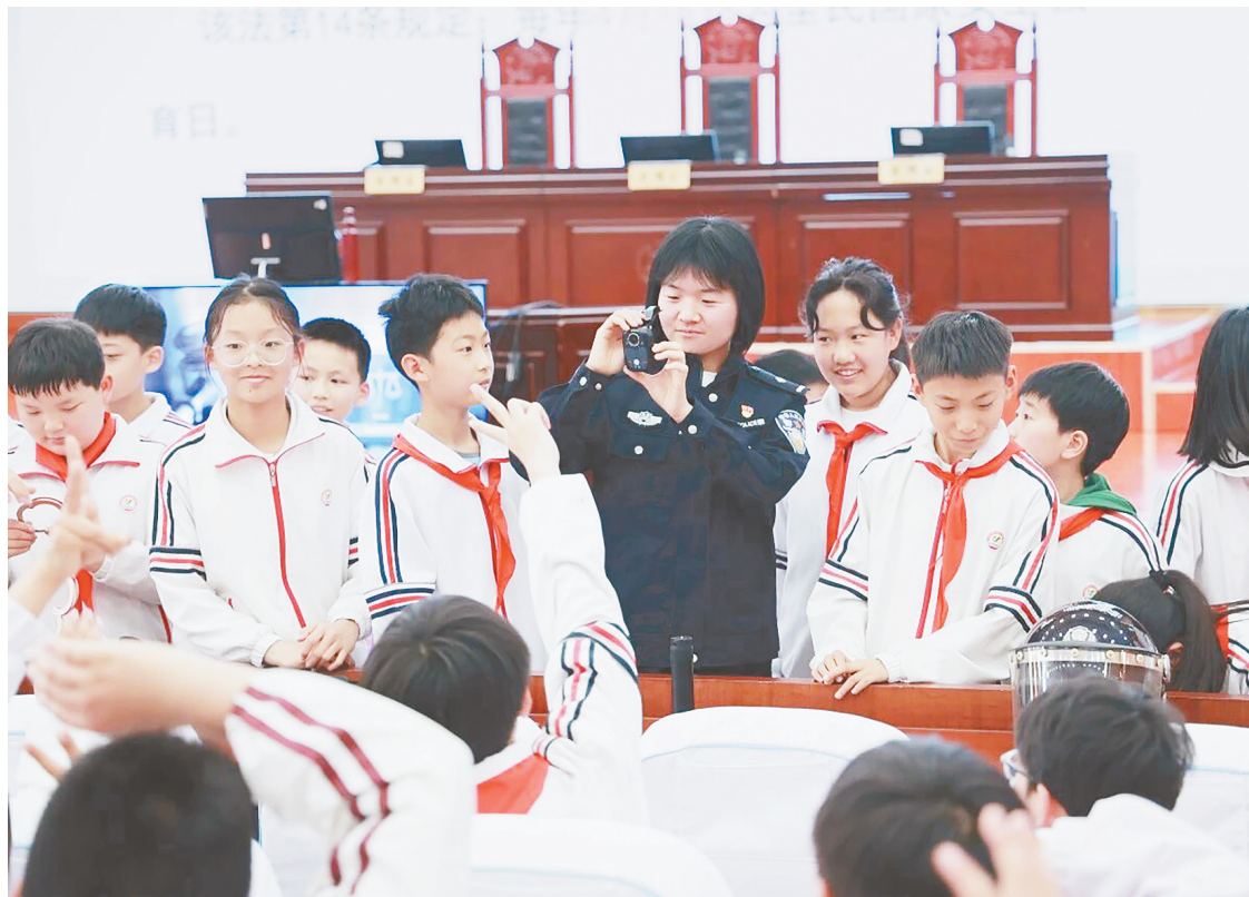
4月15日是我国第十一个全民国家安全教育日。当天,市中级人民法院干警带领市实验小学的“红领巾”沉浸式打卡诉讼服务中心、一号审判庭等,现场体验智慧法院的高效与便捷。干警们将保守国家秘密、防范网络诈骗等知识融入一个个鲜活的小故事进行细致讲解,以司法力量护航青少年健康成长。