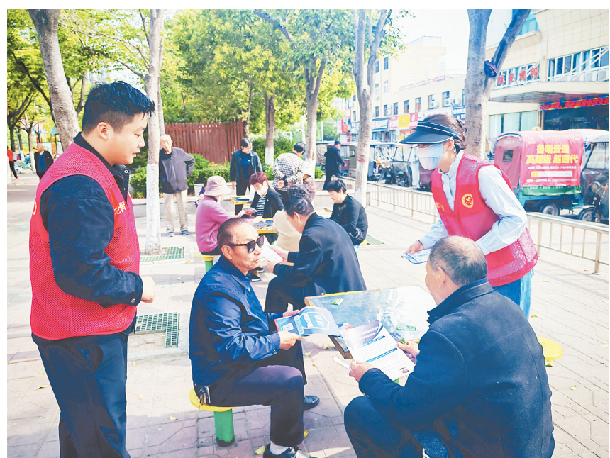
4月15日,郾城区司法局组织各司法所聚焦“统筹发展和安全 护航‘十五五’新征程”主题,开展系列法治宣传活动,营造维护国家安全的浓厚氛围。图为普法志愿者深入社区向群众普及国家安全知识。