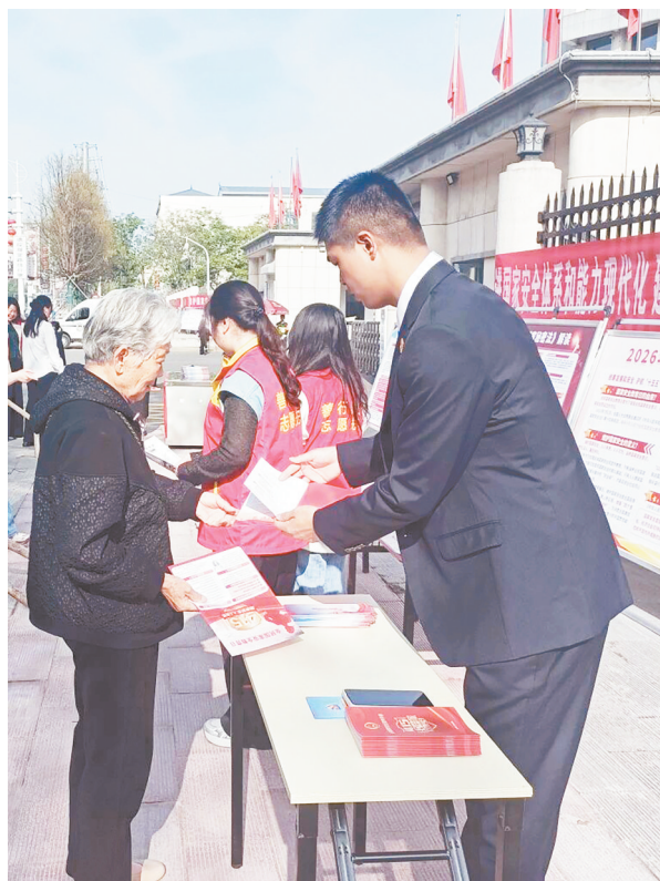
右图:4月15日,舞阳县人民检察院组织干警开展“统筹发展和安全 护航‘十五五’新征程”主题宣传活动。他们设置咨询台、制作宣传展板、发放宣传资料等,向过往群众讲解国家安全知识。

召陵区委政法委相关负责人表示,将继续开展国家安全法治宣传“六进”活动,让法治精神与国家安全理念在基层落地生根,为服务保障“十五五”良好开局营造浓厚的社会氛围。