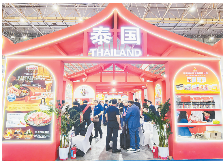
泰国展馆内客商云集。