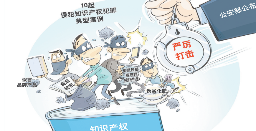
4月26日世界知识产权日即将到来之际,公安部4月24日公布10起严厉打击侵犯知识产权典型案例。