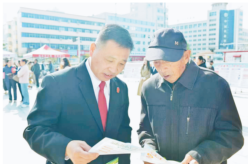
4月23日,临颍县人民法院固颍人民法庭组织干警深入社区开展普法宣传,把法治服务送到群众“家门口”。