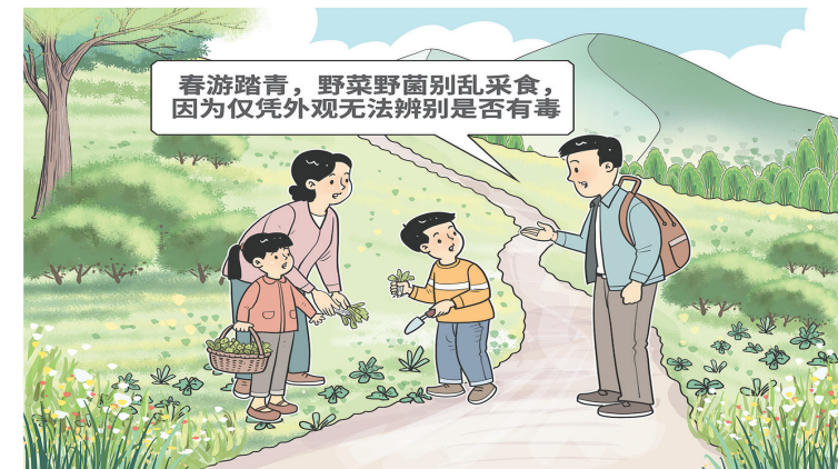
春和景明，踏青正当时。记者了解到，不少市民外出游玩时会顺手采摘或购买野菜、野生菌。然而，野菜、野菌种类繁杂，可食用品种与有毒剧毒品种的外形相似，难以辨别。