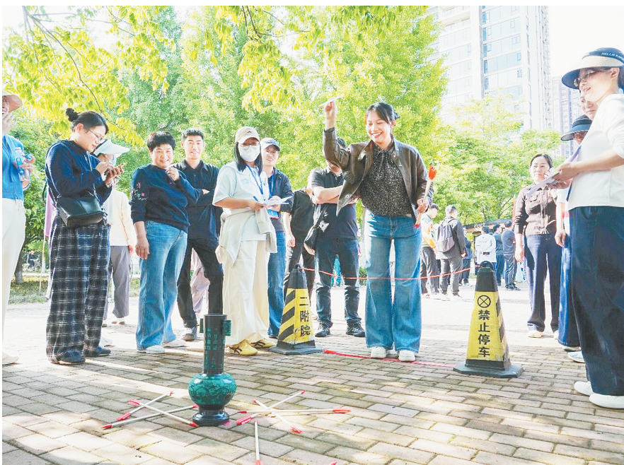
4月23日下午，漯河医专二附院（市骨科医院、漯河市立医院）组织开展2026年春季职工运动会。