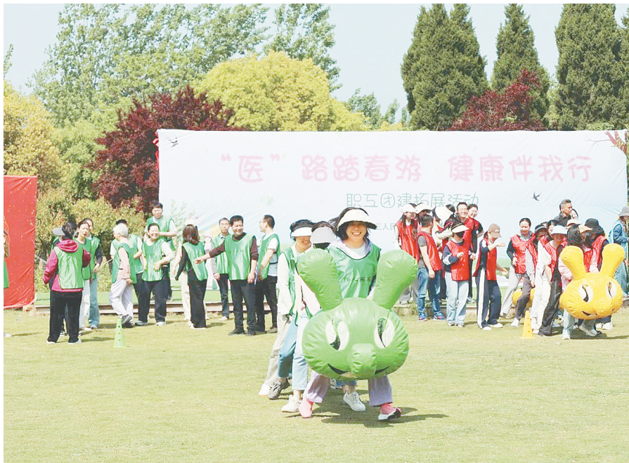
4月24日，市三院（市妇幼保健院）组织开展“医”路踏青游 健康伴我行”主题团建活动。医院班子成员与职工共享运动的乐趣。