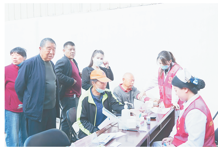
4月25日上午，郾城区中医院组织骨干医疗团队到淞江街道马坡村开展“情系家乡 名医家乡行”主题义诊活动，把优质、便捷的医疗服务送到群众家门口。