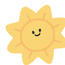
郾城小学五(6)班 马希作