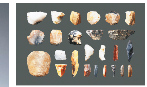
↑ 河南新郑裴李岗遗址出土的旧石器晚期晚段典型石器(资料照片)。

著名的红山文化,因郑家沟遗址延长了时间轴线,扩大了分布范围。北京大学考古文博学院教授赵辉说,河北北部从红