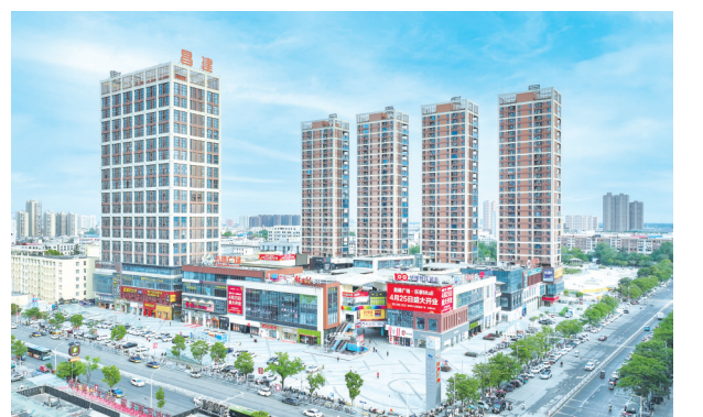
商贸物流产业发达,现代服务业繁荣,“三产”服务业总量和增幅始终居全市首位。图为全市最大的城市综合体——昌建广场。

没有等出来的辉煌,只有干出来的精彩。源汇区将更加紧密地团结在以习近平总书记为核心的党中央周围,在省、市委、市委坚强领导下,咬定目标、撸起袖子加油干,为开创中国式现代化建设源汇新局面而努力奋斗!