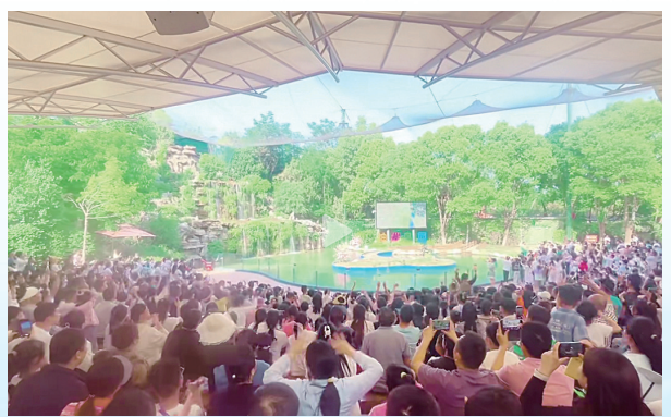
文商旅融合中心区域地位进一步巩固,河上街景区享誉豫中南,神州鸟园成为首选研学游体验式消费基地。图为学生等待观看《孔雀东南飞》表演。

源汇区第十五次党代会以来的五年,是全区攻坚克难、稳中突进的五年。五年来,区委坚持以习近平新时代中国特色社会主义思想为指导,在中央和省、市委的坚强领导下,牢固树立和践行正确政绩观,坚持统筹当前与长远、兼顾民生与发展,在逆境中稳住阵脚、在转型中积蓄势能、在实干中赢得民心,圆满完成“十四五”既定目