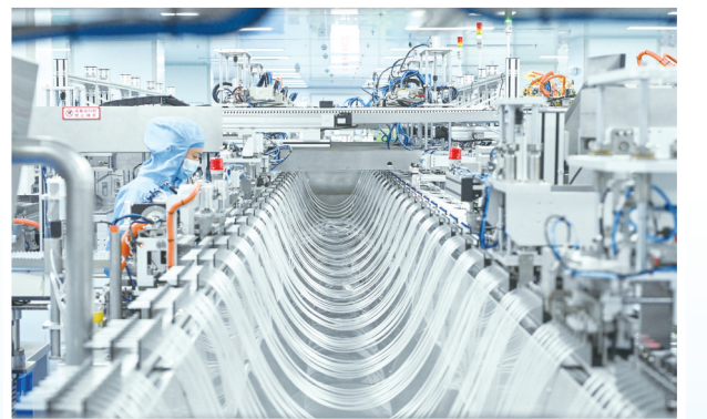
医疗器械产业全省领先、全国知名。图为曙光汇康集团汇康生物科技股份有限公司生产车间。