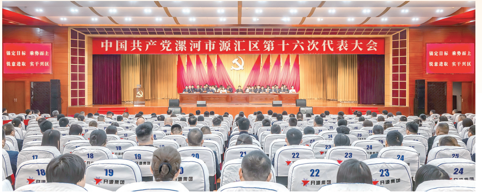
中国共产党漯河市源汇区第十六次代表大会会场。