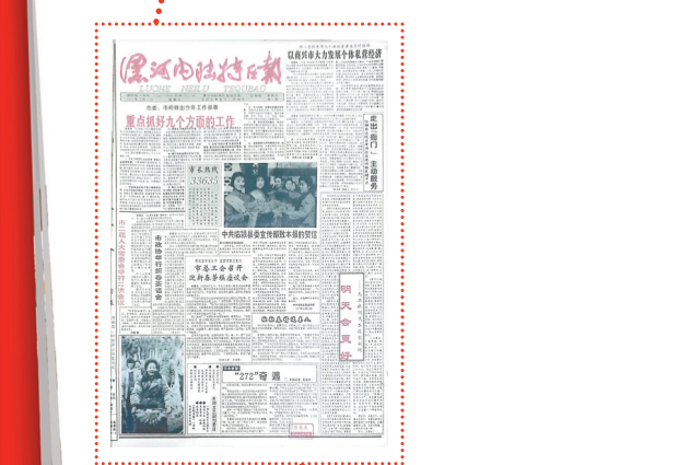
1993年1月1日第一期《漯河内陆特区报》