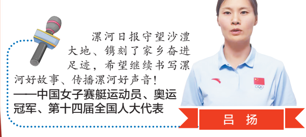
漯河日报守望沙澧大地，镌刻了家乡奋进足迹，希望继续书写漯河好故事、传播漯河好声音！ ——中国女子赛艇运动员、奥运冠军、第十四届全国人大代表 吕扬