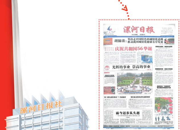
2005年10月1日第一期《漯河日报》