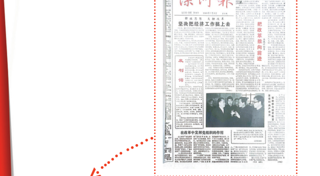
1986年7月1日第一期《漯河报》