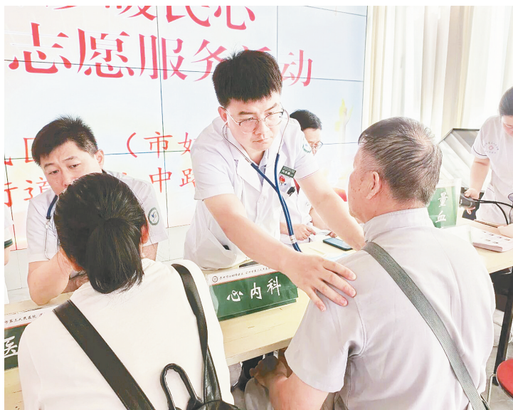
近日,市三院(市妇幼保健院)组织专家到源汇区顺河街街道泰山中路社区开展义诊活动。